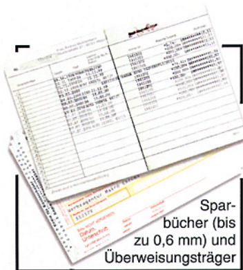
Spar- bücher (bis zu 0,6 mm) und Überweisungsträger