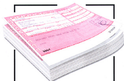
Ideal für Rezepte und andere Formulare

Multitalent für erhöhte Produktivität und verkürzte Wartezeiten im Service-Bereich!